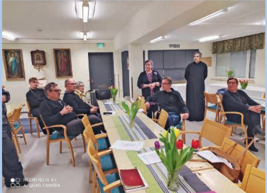
Luottamushenkilöt ja työntekijät vakavina, vaikka koronaviruksesta oli vähän tietoa helmikuussa.

Seminaarin anti menee neuvoston pohdittavaksi ja sen toimenpiteitä varten.