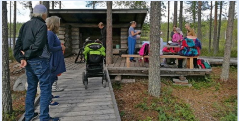
Syysretki Paltasen suopuistoon 1.8.