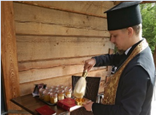
Joroisten tsasounan syksyinen hunajasato sai siunauksen