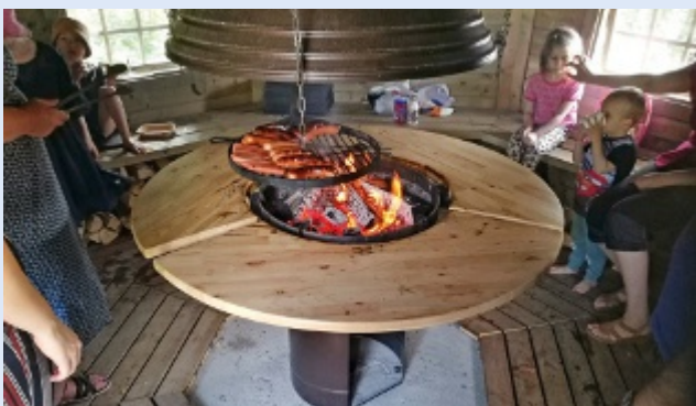
Kotakirkkokahvit Mikkelin Orjäärvellä 9.8.2020