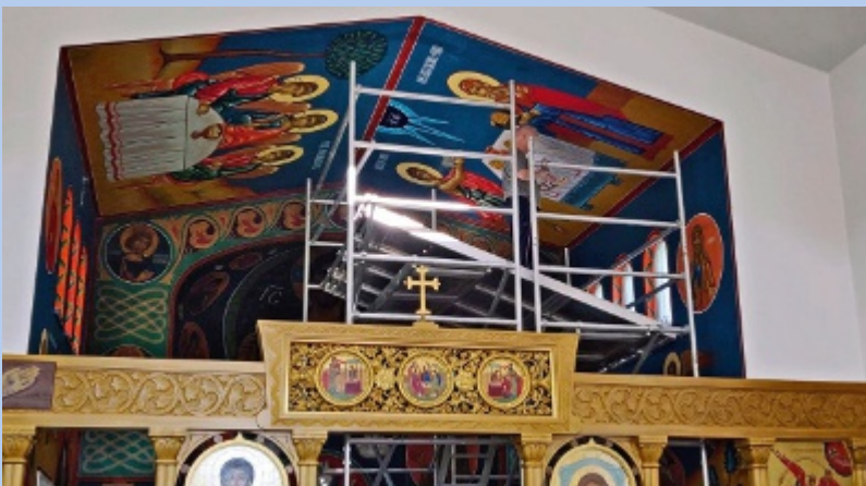
Mikkelin Pyhän ylienkelel Mikaelin kirkko uudelleen siunataan kirkon praasniekan yhteydessä 8.11.