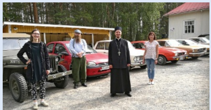
Seurakunta mukana Mikkelin mobilistien tapahtumassa ajoneuvoja siunassa 22.8.